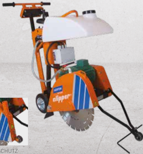
CS451 ET BLATTSCHUTZ