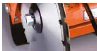
DOPPELBLATTMONTAGE (NUR CS 451E)