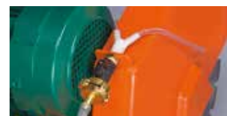
ANSCHLUSSMÖGLICHKEIT FÜR EXTERNE WASSERZUFÜHRUNG (NUR CS451 E)

WIR EMPFEHLEN DEN EINSATZ FOLGENDER DIAMANTSCHLEIBE FÜR CS451 E & ET